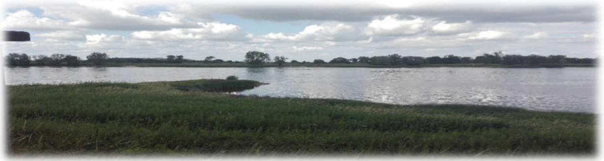
Ein herrlicher Panoramablick!